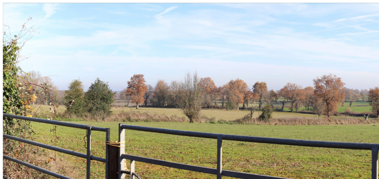
Photographie de l'état initial à 50°